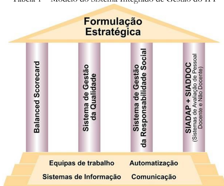
Tabela 1 – Modelo do Sistema Integrado de Gestão do IPP

O Sistema Integrado de Gestão (SIG) adotado pelo IPP resulta da integração de diversos componentes, conforme esquema apresentado abaixo. Significa isto que “o todo é superior à soma das partes”. Não importa deter cada um dos instrumentos de controlo mas sim o resultado da interação entre eles.